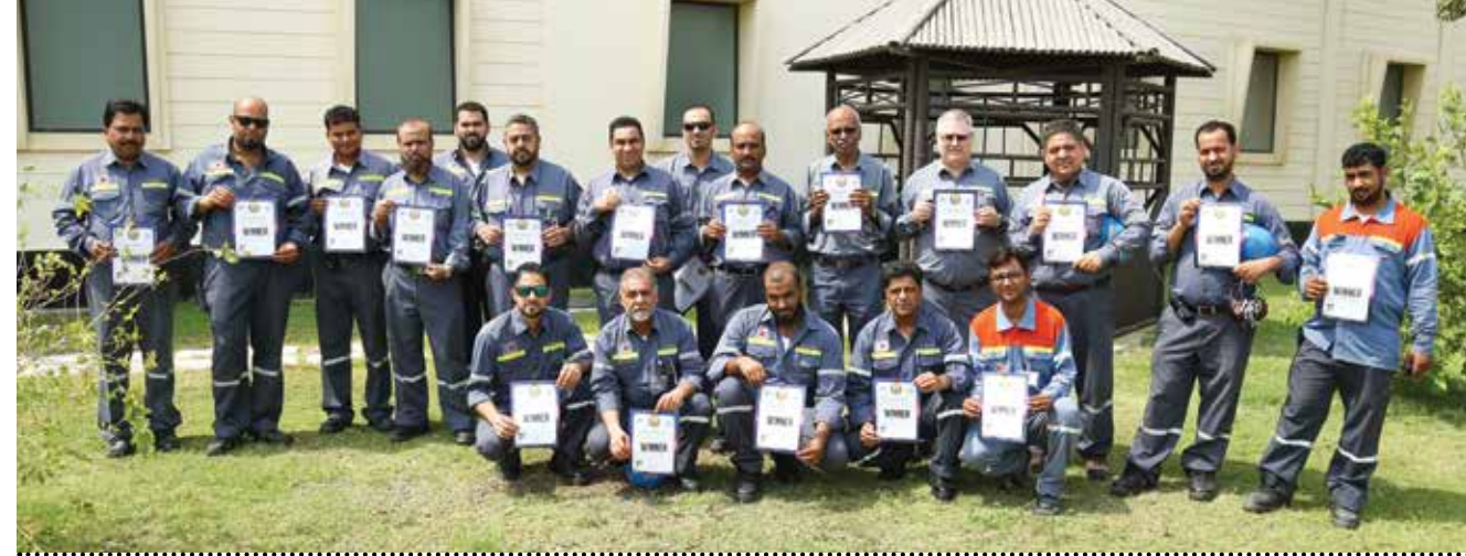
24 DISTRIBUTION OF WINNER CERTIFICATES TO ALL EMPLOYEES توزيع شهادات WINNER على جميع الموظفين