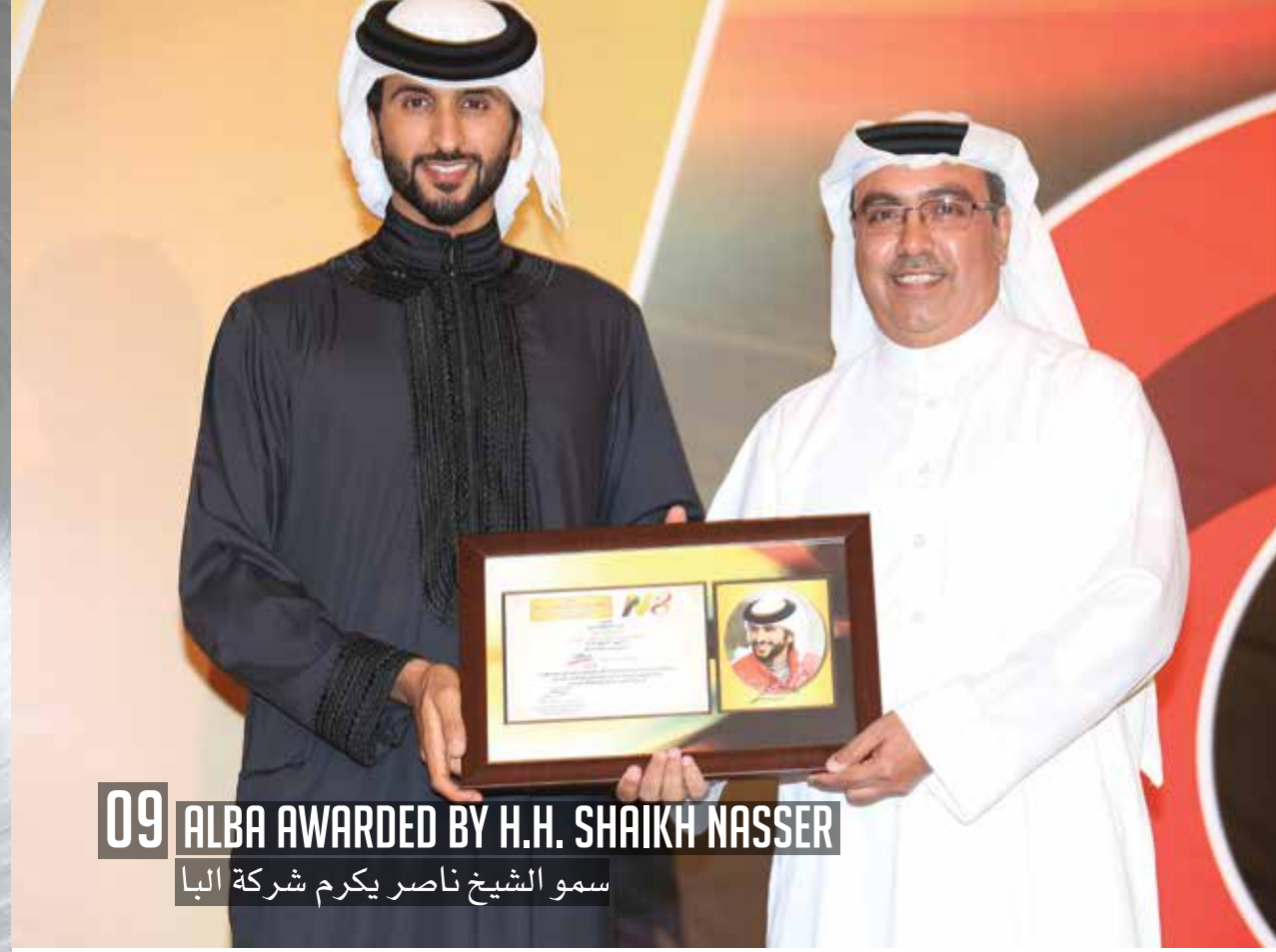
09 ALBA AWARDED BY H.H. SHAIKH NASSER سمو الشيخ ناصر يكرم شركة البنا