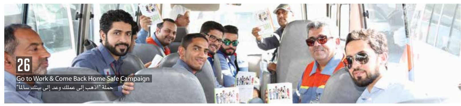
26 Go to Work & Come Back Home Safe Campaign حملة "اذهب إلى عملك وعد إلى بيتك سالماً"