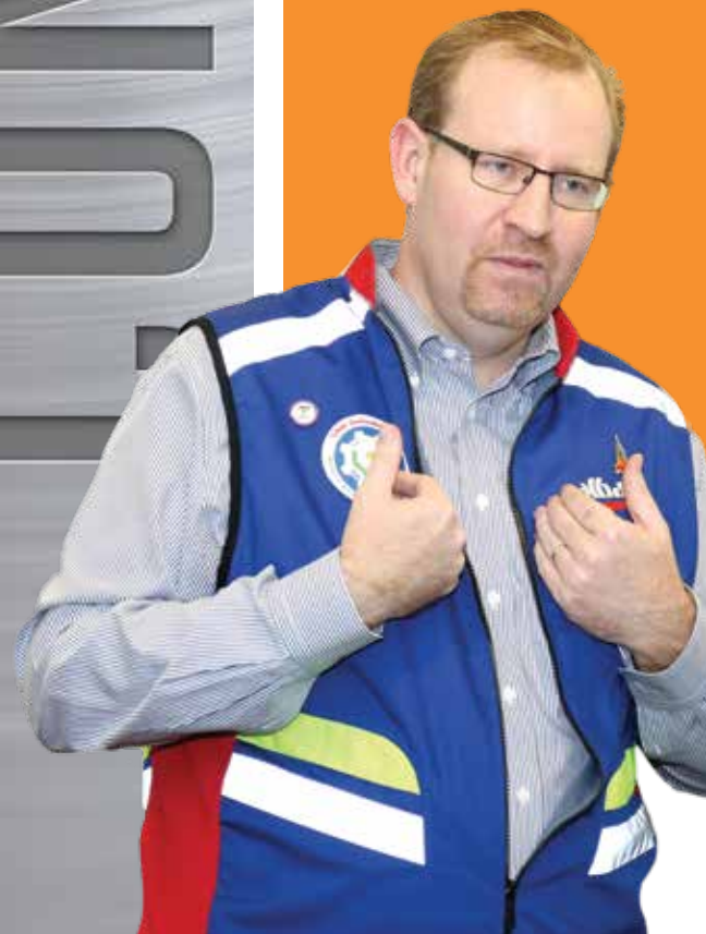
10 WOWS! WORDS OF WISDOM BY CEO الرئيس التنفيذي يناقش مقولاته المفضلة مع الموظفين