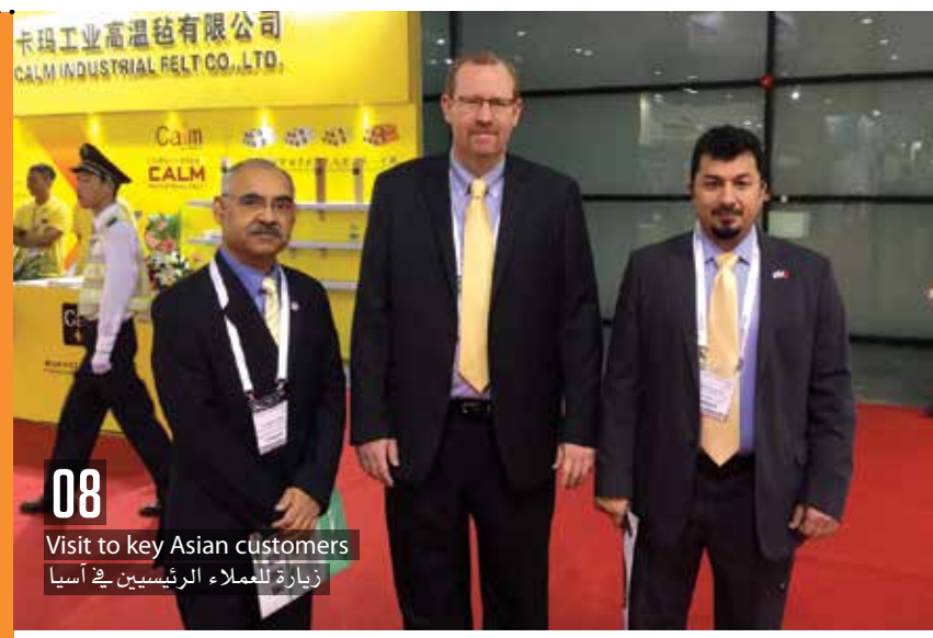
08 Visit to key Asian customers زيارة للعملاء الرئيسيين في آسيا