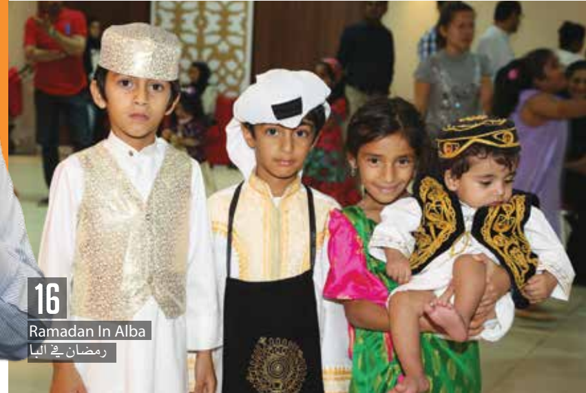
16 Ramadan In Alba رمضان في البنا