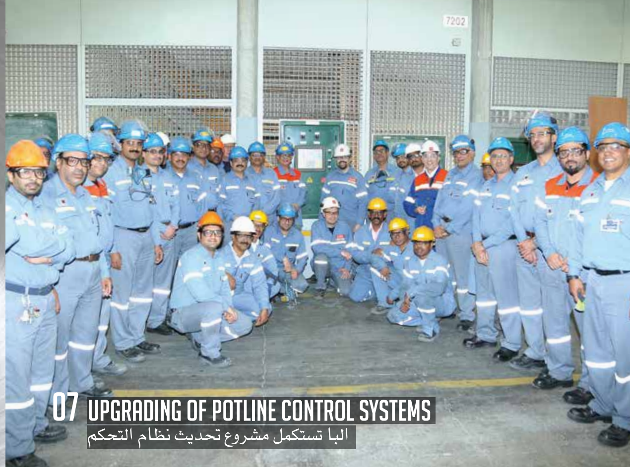
07 UPGRADING OF POTLINE CONTROL SYSTEMS البنا تستكمل مشروع تحديث نظام التحكم