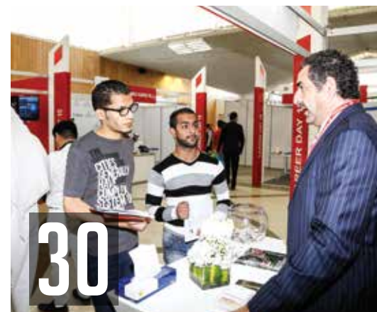
30 Alba key supporter of UOB's Careers Day البنا تشارك في معرض يوم المهن