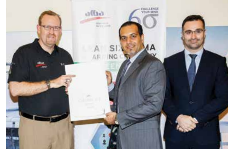
22 25 EMPLOYEES GET GREEN BELT CERTIFICATION IN SIX SIGMA 25 موظفاً يحصلون على الحزام الأخضر في 6 سيجما