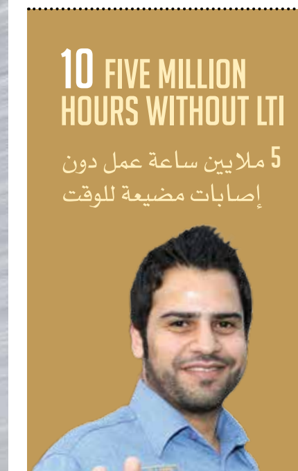
10 FIVE MILLION HOURS WITHOUT LTI 5 ملايين ساعة عمل دون إصابات مضيعة للوقت