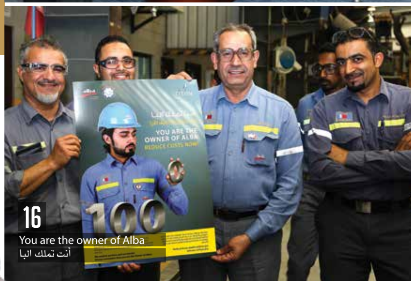
16 You are the owner of Alba أنت تملك البنا