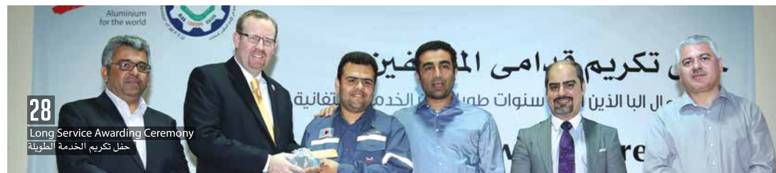
28 Long Service Awarding Ceremony حفل تكريم الخدمة الطويلة