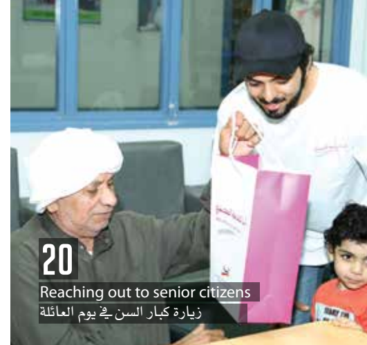
20 Reaching out to senior citizens زيارة كبار السن في يوم العائلة