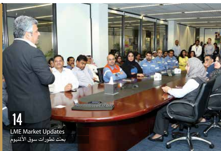
14 LME Market Updates بحث تطورات سوق الألمنيوم