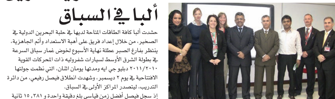
لمتدربين المهنيين في ألبا مع فريق العمل في بوليتكنيك البحرين