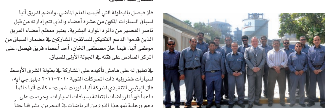
ترقية موظفين بحرينيين إلى مناصب عليا