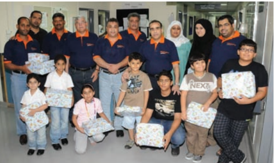
Alba distributes Eid Gifts

The newly appointed workers who were all recent graduates from educational establishments in Bahrain have joined as operators in the Carbon, Reduction and Workshop & Metal Service departments.