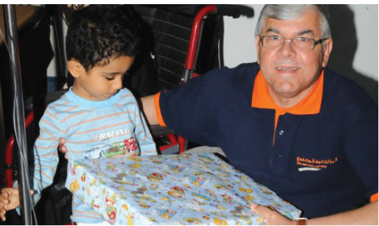
Alba employees spread joy and happiness during the Eid season