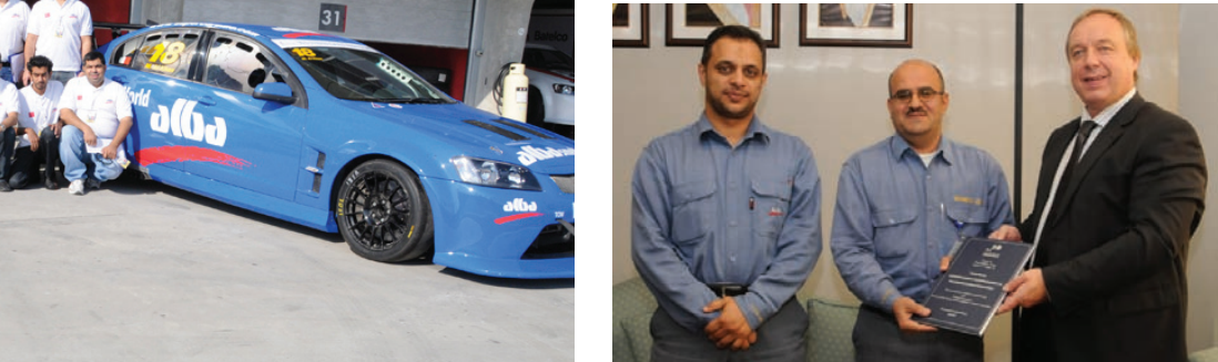
موظفي مشروع البحث

We send you our congratulations and wish them blessings as they embark on a new life as parents and as married couples.