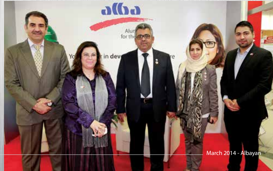
March 2014 - Albayan

Alba was a key participant at The Minerals, Metals & Materials Society (TMS) 2014 Annual Meeting and Exhibition, which was held in February 2014 at San Diego, California, USA.