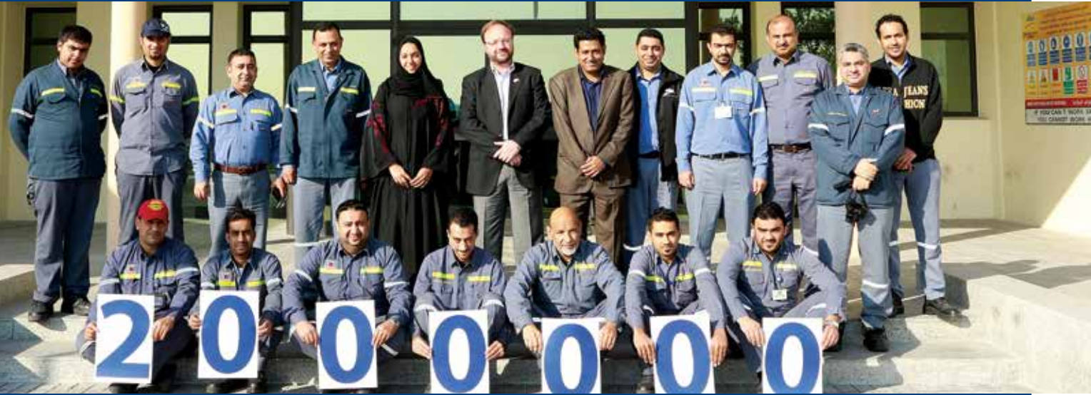
دائرة الدعم التقني للعملاء تنجز مليوني ساعة عمل دون اصابة مضيعة للوقت

حققت دائرة الدعم التقني للعملاء إنجازاً لافتاً وذلك من خلال اتمامها للمليون ساعة عمل دون أية إصابة مضيعة للوقت، الأمر الذي يعكس التزام موظفي الدائرة المستمر بسلوكيات وممارسات العمل الآمنة. وقد أقيم حفل في مختبر الشركة بهذه المناسبة حضره الرئيس التنفيذي للتسويق، جون بابتيست لوكا والذي قام بتهنئة فريق العمل على أدائهم المتميز في مجال السلامة.