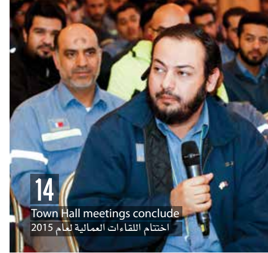
14 Town Hall meetings conclude اختتام اللقاءات العمالية لعام 2015