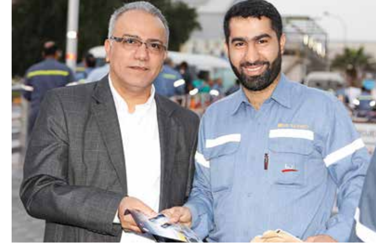
20 ALBA ORGANISES "SAFETY BREEZE" WEEK