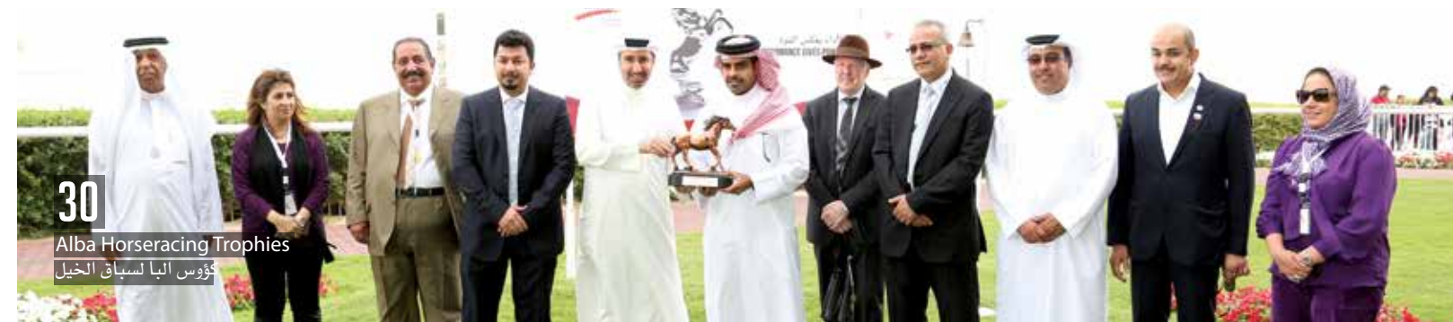
30 Alba Horseracing Trophies كؤوس البا لسباق الخيل