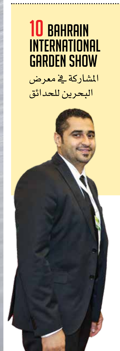
10 BAHRAIN INTERNATIONAL GARDEN SHOW المشاركة في معرض البحرين للحدائق