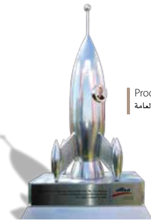
Produced by Public Relations Team انتاج وتنفيذ فريق العلاقات العامة