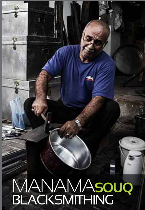
MANAMA SOUQ BLACKSMITHING

My journey with photography began in childhood when I captured my family's precious moments like birthdays and travels. In 2006, photography became real close to my heart when I started developing an interest in professional camera and buying them. Natural views and portrait photos is what I like doing best.