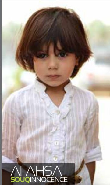
AI-AHSA SOUQ INNOCENCE