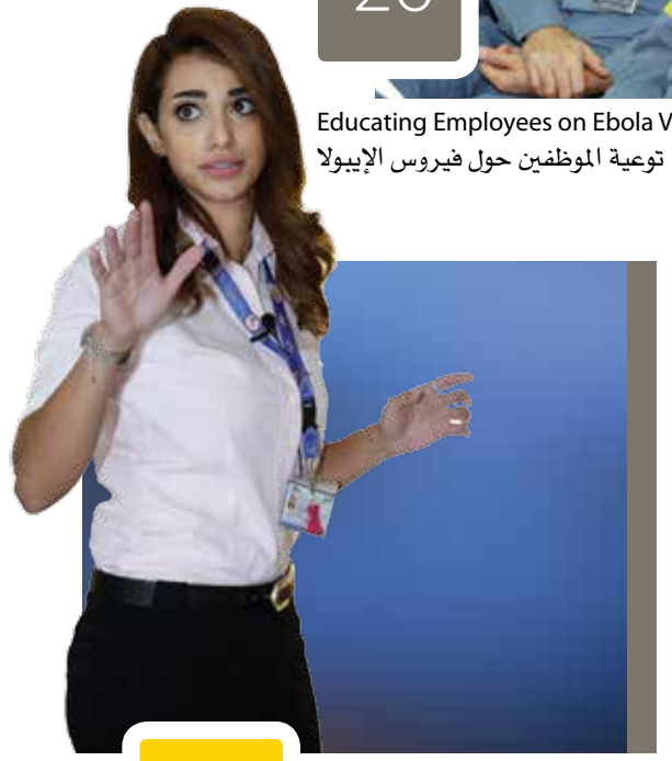
Educating Employees on Ebola Virus توعية الموظفين حول فيروس الإيبولا