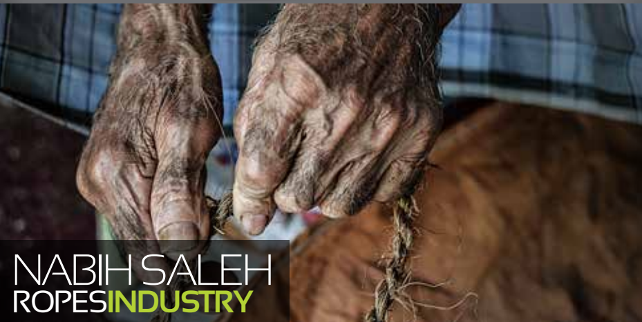
NABIH SALEH ROPES INDUSTRY

My journey with photography began in childhood when I captured my family's precious moments like birthdays and travels. In 2006, photography became real close to my heart when I started developing an interest in professional camera and buying them. Natural views and portrait photos is what I like doing best.