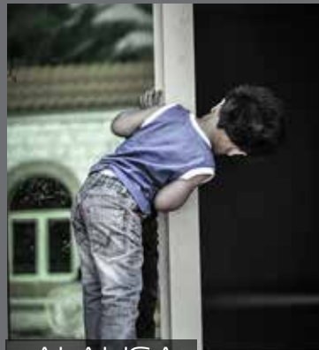
AI-AHSA KSA CURIOSITY