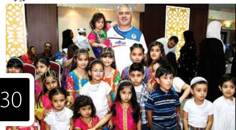
After Iftar Visits زيارات فترة ما بعد الإفطار