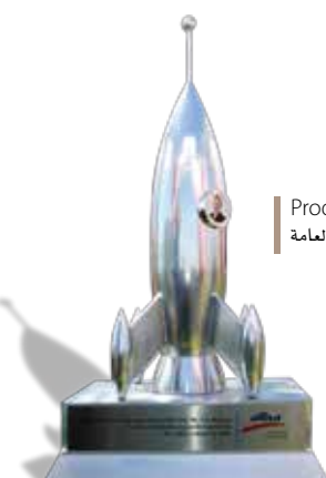
Produced by Public Relations Team انتاج وتنفيذ فريق العلاقات العامة