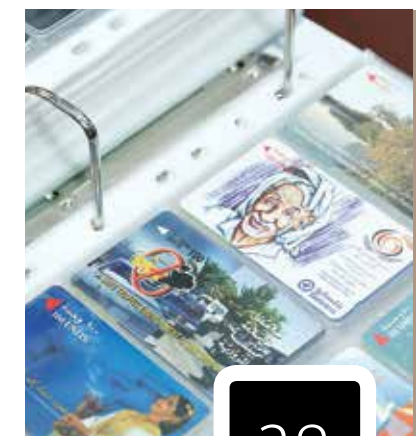
Interview with Rania لقاء مع رانيا